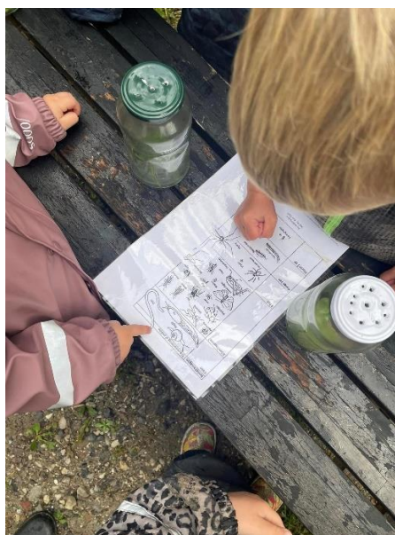
Vi tæller ben på insekter.