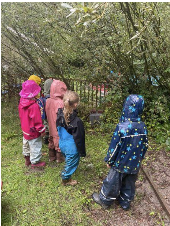
Vi bygger et pindsvinehjem.