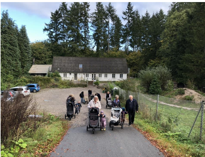
Motionsdag fra Vuggestue gruppen

Vi holder motionsdag sammen dag som skolernes motionsdag. Vi invitere barnets mor/far eller en anden betydningsfuld voksne med. Det gør at vi oplever et helt unikt fællesskab og at vi føler os en del af noget større. Vi møder mange 100 skolebørn, hepper på os og vi på dem.