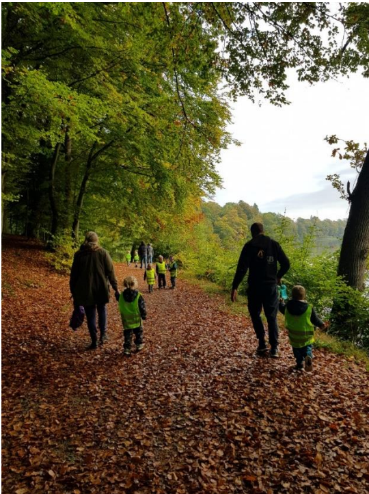
Motionsdag fra børnehaven gruppen