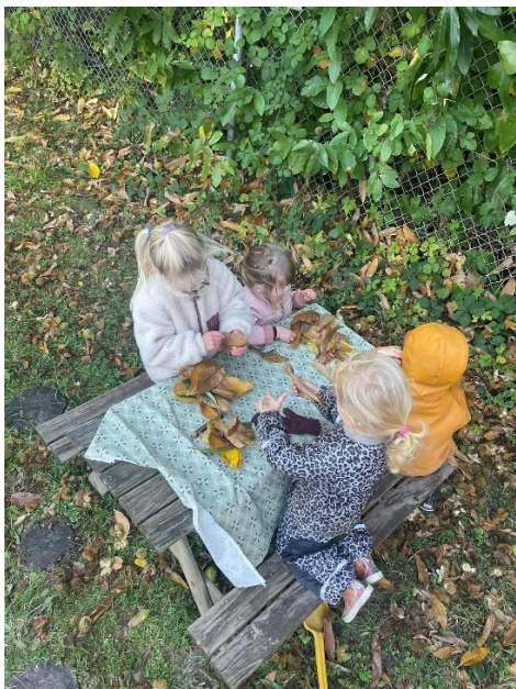
Blade på stålstråd

Vores pædagogik tager udgangspunkt i, at vi er ude det meste af dagen. Vi bruger naturen redskaber.